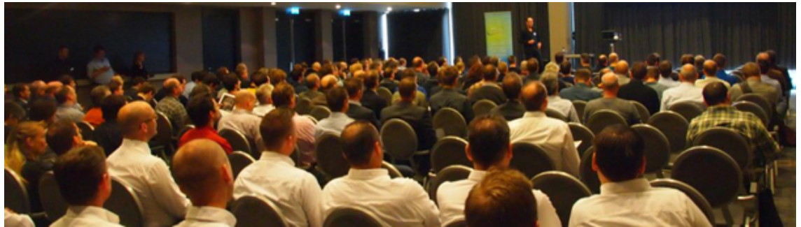
Het 21ste PTC/USER Benelux Event vindt plaats op donderdag 16 november 2017 te Hotel Eindhoven